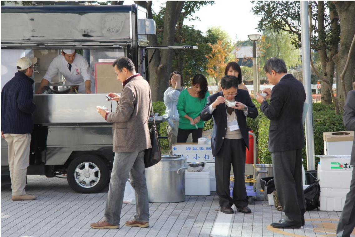
キッチンカーによる江戸前風魚の天ぷらの提供・試食