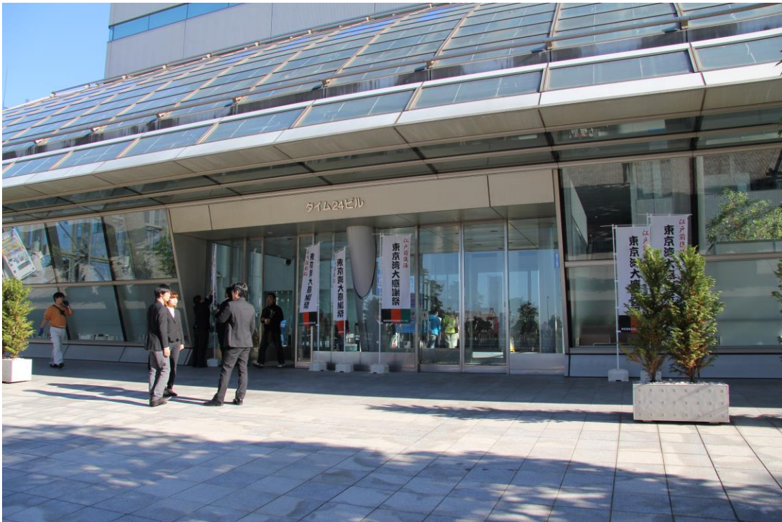
会場のタイム24ビルの入り口（屋外展示とは反対側の出入り口）