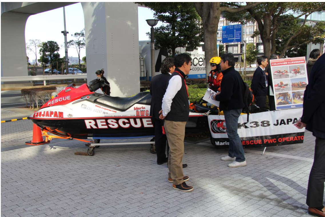
レスキュー用の水上バイク展示